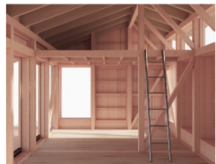
2 - Facadetegninger og interiør for det ansøgte.