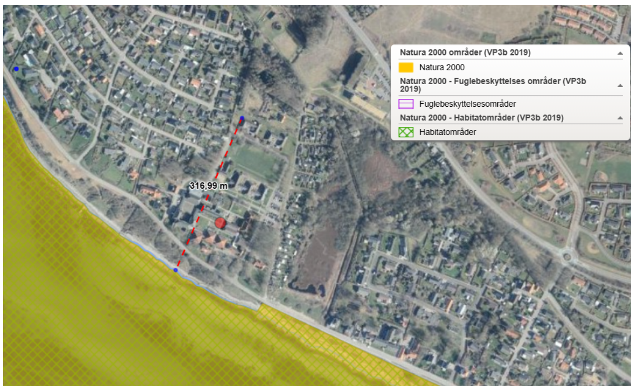
7 - Det ansøgte placering ift. det nærmeste Natura 2000-område.

Vi har ikke noget konkret kendskab til forekomst af bilag IV-arter i det konkrete område. Vi vurderer derfor at, en ændret udnyttelse af arealet, ikke vil kunne have negativ betydning for bilag IV-arter.