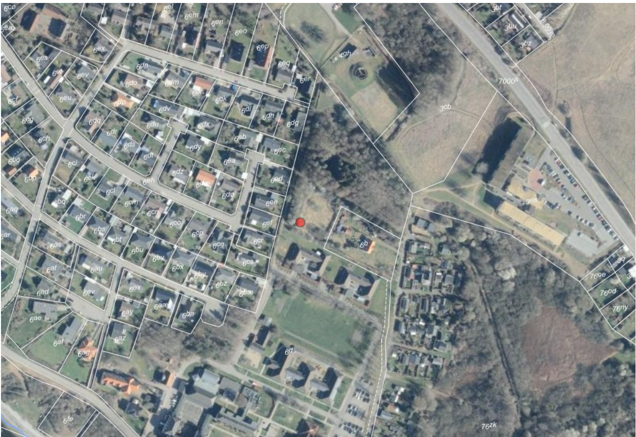
6 - Oversigtskort som viser placeringen af det ansøgte i forhold til omkringliggende naboer.

Region Sjælland oplyser, at personale og besøgende skal anvende den eksisterende fælles parkeringsplads, og det vurderes, at parkeringspladsen er tilstrækkelig til at håndtere trafikken i området. I ansøgningen er der desuden beskrevet en parkeringsplads, som skal anvendes til beboerne i form af en handicapbus, der bruges i forbindelse med beboernes ture ud af huset. Der er ligeledes indarbejdet både vendeplads og afsætningsplads til handicapbussen, så der sikres hensigtsmæssig adgang uden at belaste nærområdet.