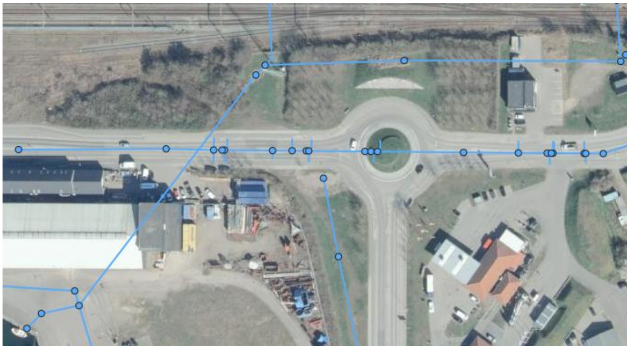
Figur 1: Luftfoto af rundkørslen ved Østre Havnevej/Sydhavnsvej med regnvandsledninger vist. Luftfotoet er ikke målfast.