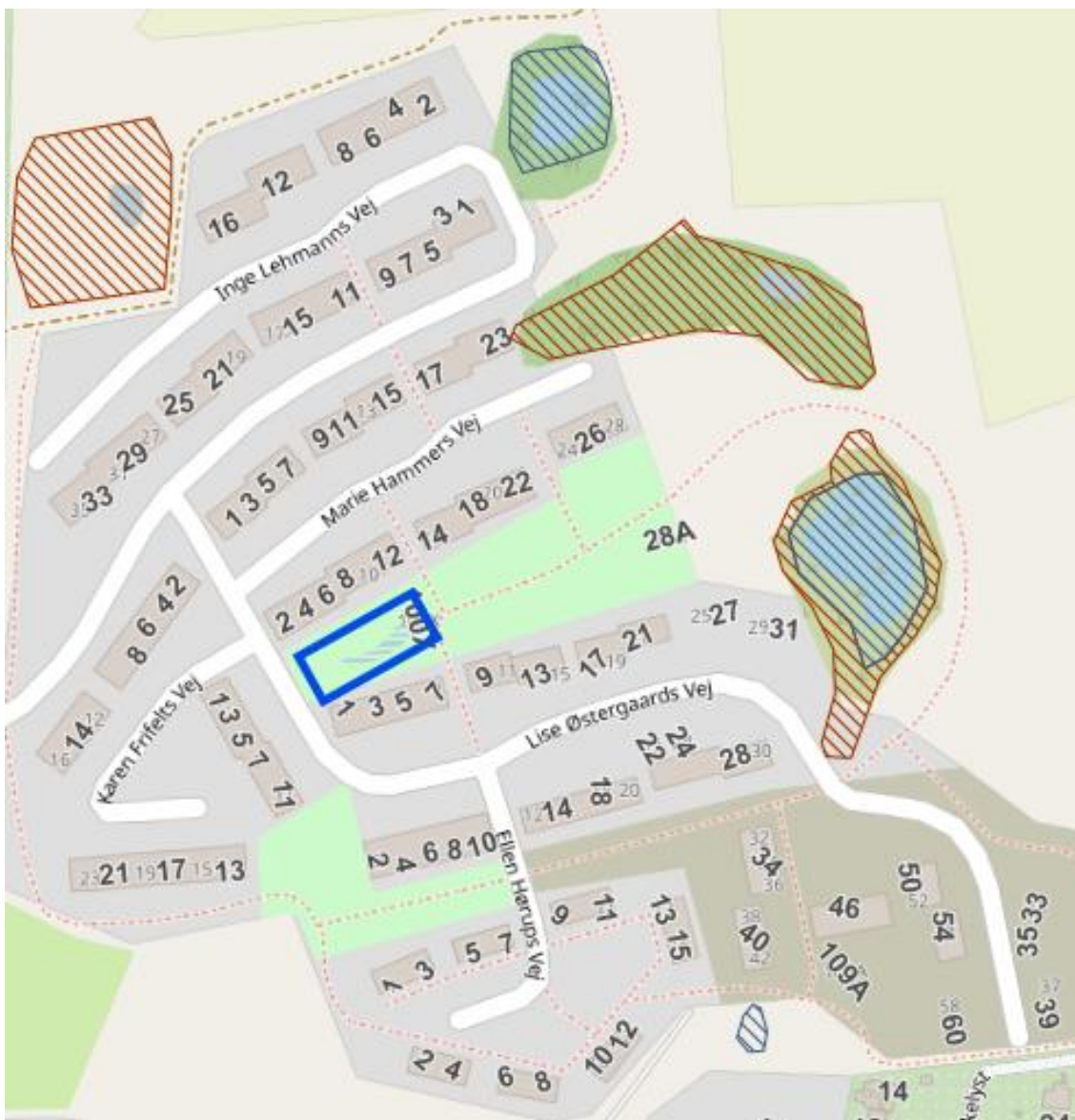
Figur 1: Kort over området med § 3 beskyttede arealer vist. Firkantet blå markering viser placeringen af regnvands / forsinkelsesbassinet. Luftfotoet er ikke målfast.