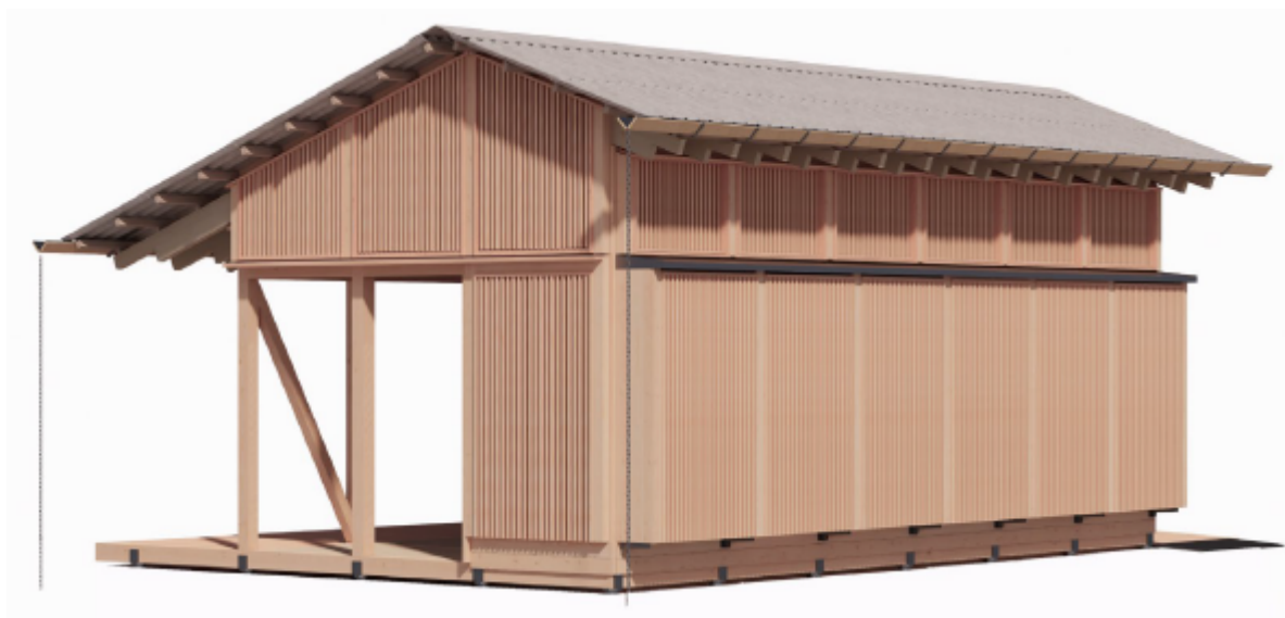
3 – Facadetegninger af den ansøgte pavillon.