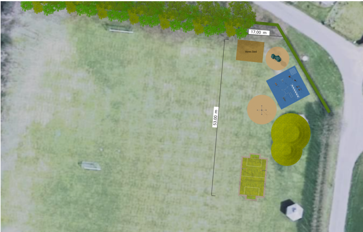
1 - Situationsplan som viser placeringen af den ansøgte pavillon nordligst på arealet og aktivitetsarealet i tilknytning hertil.