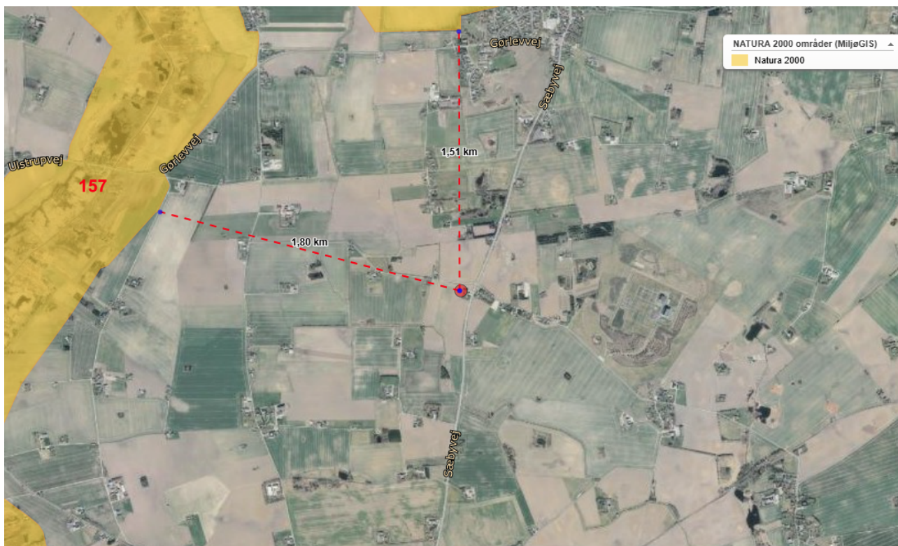
3 - Det ansøgte placering ift. det nærmeste Natura 2000-område.