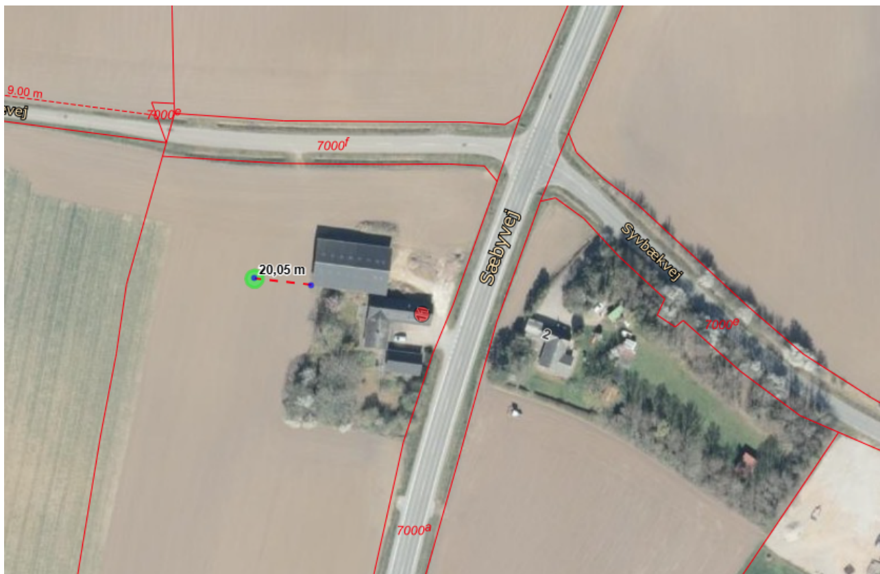
2 - Oversigtskort som viser placeringen af det ansøgte i forhold til nærmeste nabo.

Vi har skriftligt orienteret naboerne om det ansøgte 5 , og har ikke modtaget bemærkninger hertil.