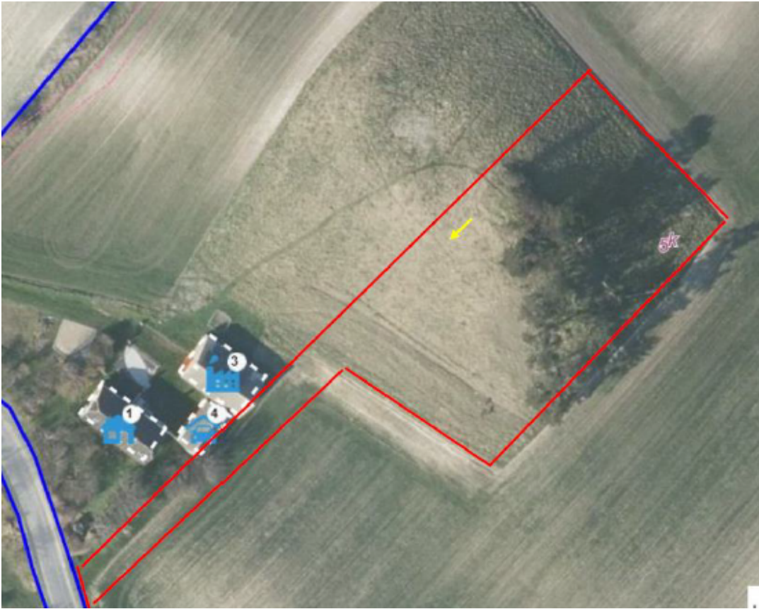
5 - Område med mulighed for at besøge fortidsminde