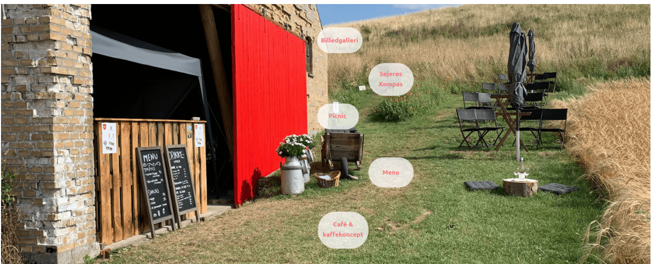
4 - Udendørs borde og stole ved laden