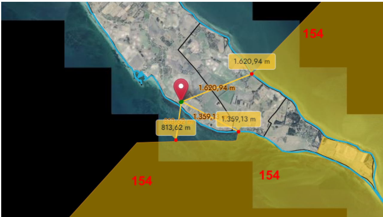
9 - Det ansøgte placering ift. de nærmeste Natura 2000-områder