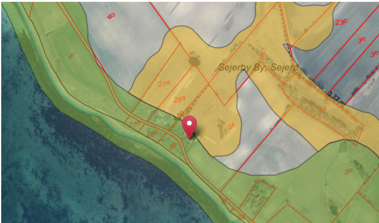
10 - Økologiske forbindelser (grøn) og potentielle økologiske forbindelser (gul)

I potentielle økologiske forbindelser skal dyr og planter spredningsmuligheder i landskabet fremmes. Det tilstræbes at eksisterende naturområder bevares.