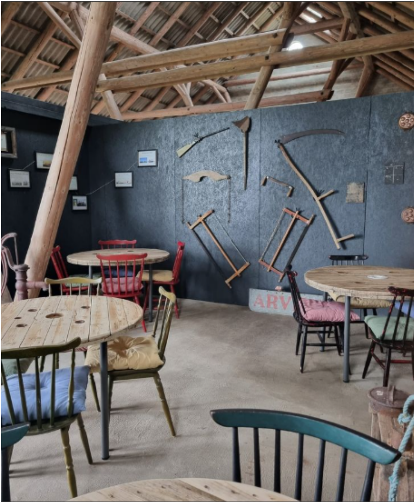
3 - Indrettet cafe i lade