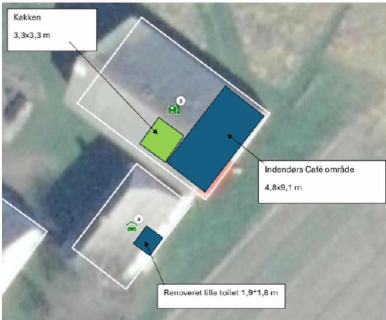
2 - Indendørs cafe, køkken og renoveret toilet