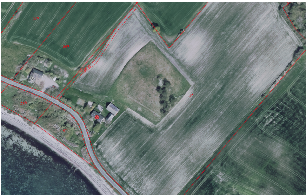
8 - Oversigtskort som viser Mastrupvej 39 i forhold til nærmeste nabo

Vi har skriftligt orienteret naboerne om det ansøgte 5 i maj 2025 og har ikke modtaget bemærkninger hertil. Der er ikke tilkommet nye naboer siden da og de ændringer, som ansøger ønsker i forhold til det naboorienterede, er indvendige ændringer, der ikke vurderes at være af betydning for naboerne.