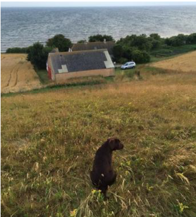
6 - Billedet er taget ved den gule pil på foregående kort og i pilens retning