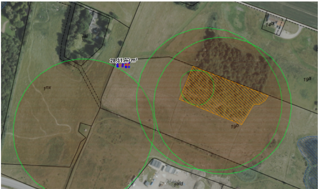
1 - Situationsplan som viser placering af læskur og fangefold udenfor fortidsmindebeskyttelseslinjer