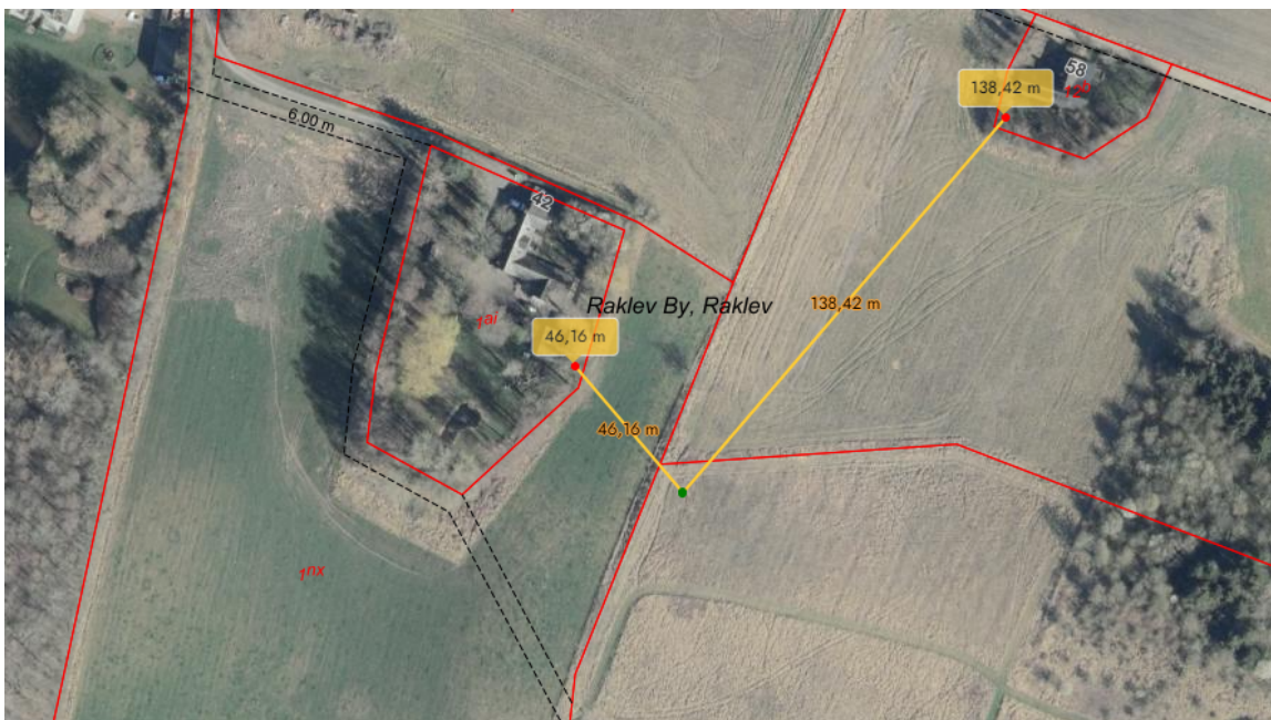
4 - Oversigtskort som viser placeringen af det ansøgte i forhold til omkringliggende naboer.

Der er ikke foretaget naboorientering 5 , da vi vurderer, at det ansøgte er af underordnet betydning for naboerne, da der ikke er nogen matrikelnaboer. Der er i øvrigt god afstand til nærmeste nabo, og det ansøgte vil ikke ændre områdets karakter væsentligt.