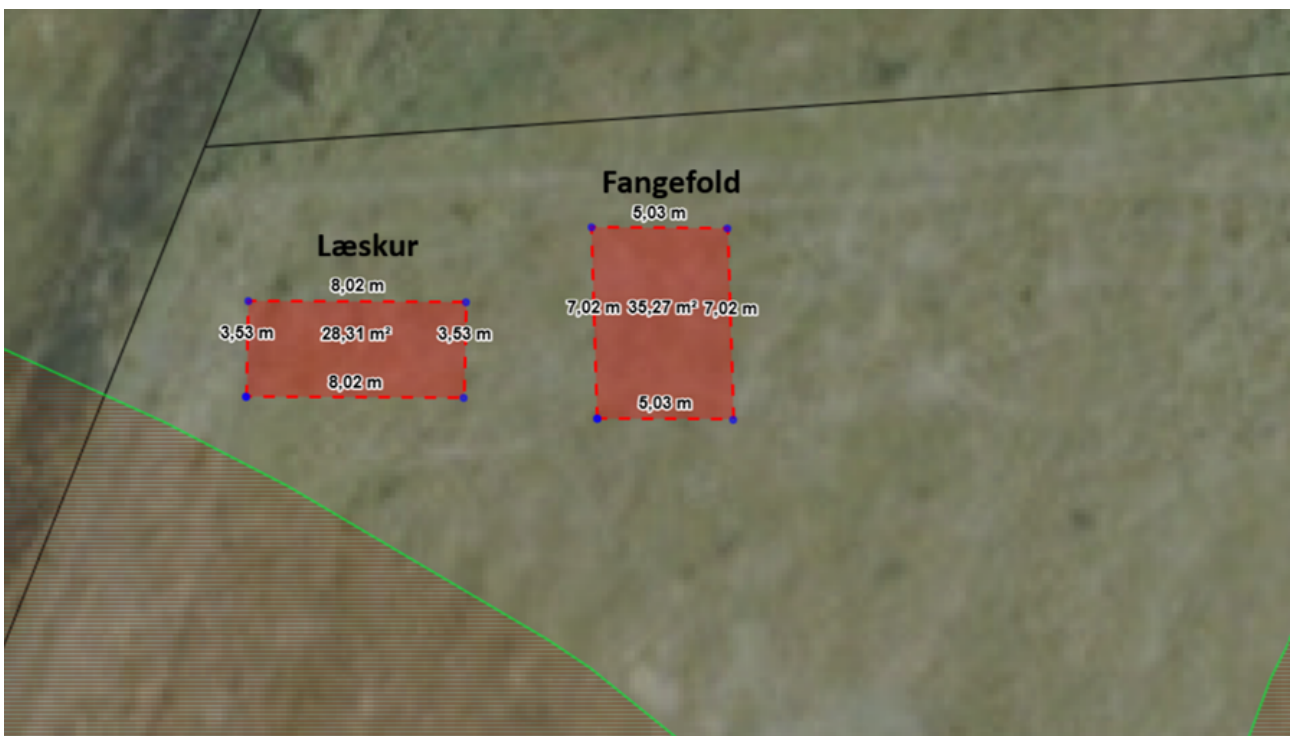
2 - Omtrentlige størrelse og placering af læskur og fangefold