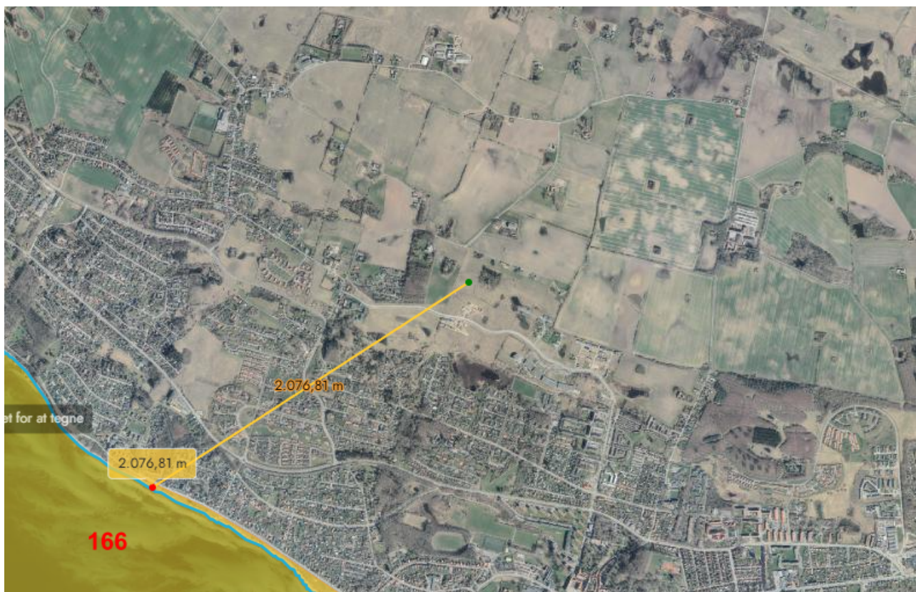
5 - Det ansøgte placering ift.de nærmeste Natura 2000-områder .

Vi har ikke noget konkret kendskab til forekomst af bilag IV-arter i det konkrete område. Vi vurderer derfor at, en ændret udnyttelse af arealet, ikke vil kunne have negativ betydning for bilag IV-arter.