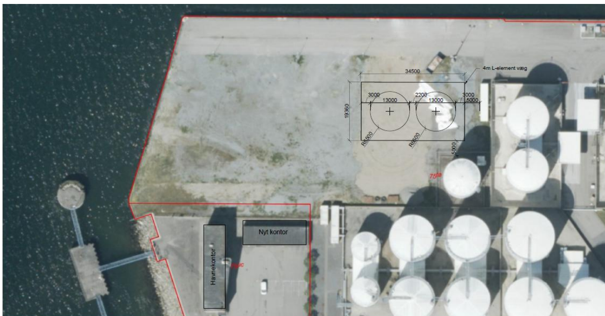
Figur 1: Luftfoto af tankgården ved Juelsmindevej med regnvandsledninger vist. Luftfotoet er ikke målfast.