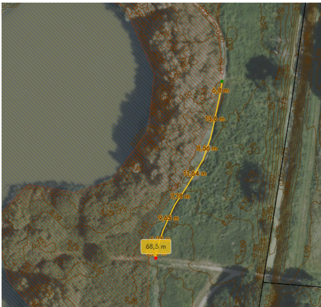
1 - Situationsplan som viser placeringen af det ansøgte.

Udførelsen af træfjællebroen vil ske i samme materialer, design og udseende som den eksisterende træfjællebro ligesom træfjællebroen belægges med skridsikker belægning lig den eksisterende.