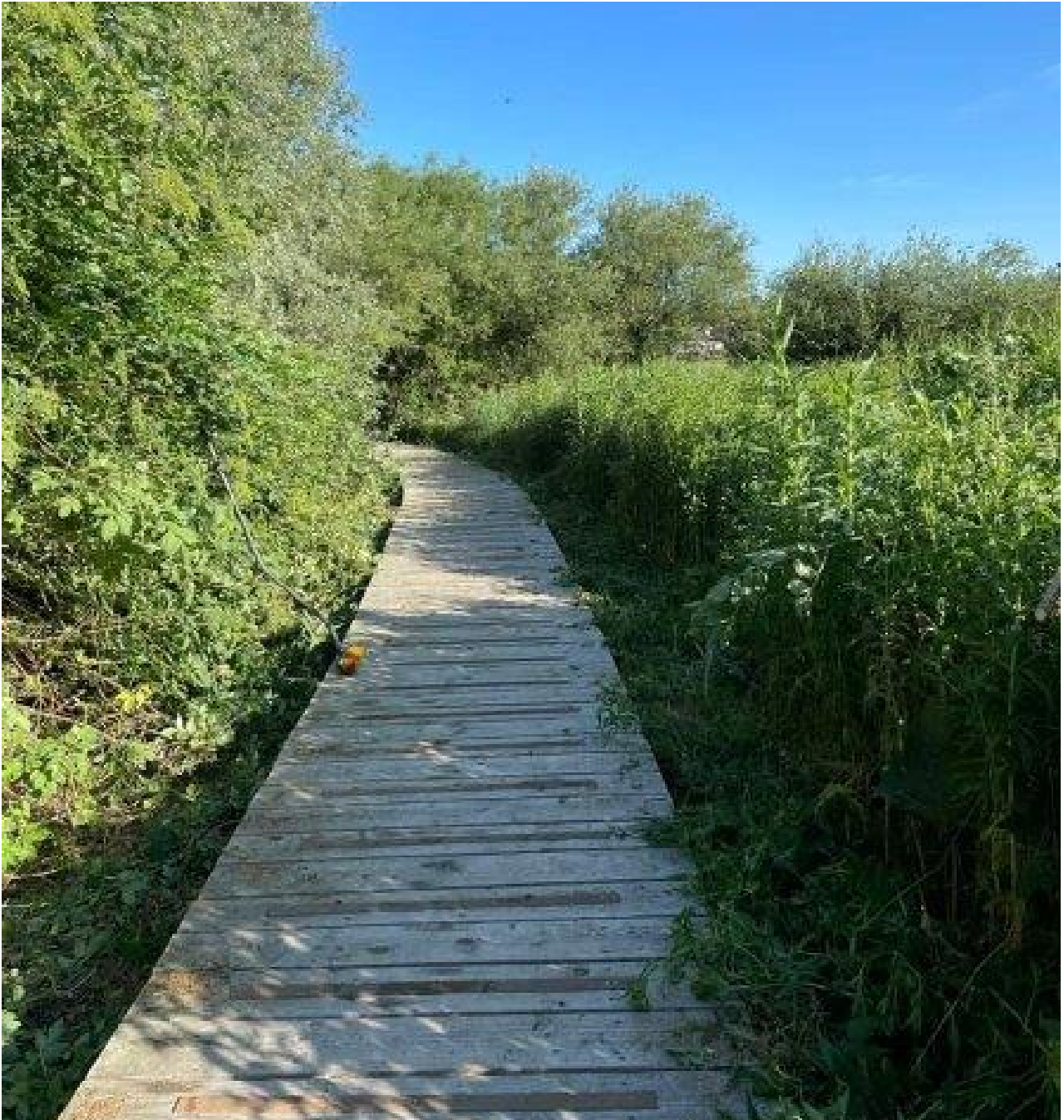
2 - Billede af eksisterende træfjællebro, som den nye bro skal opføres i stil med.