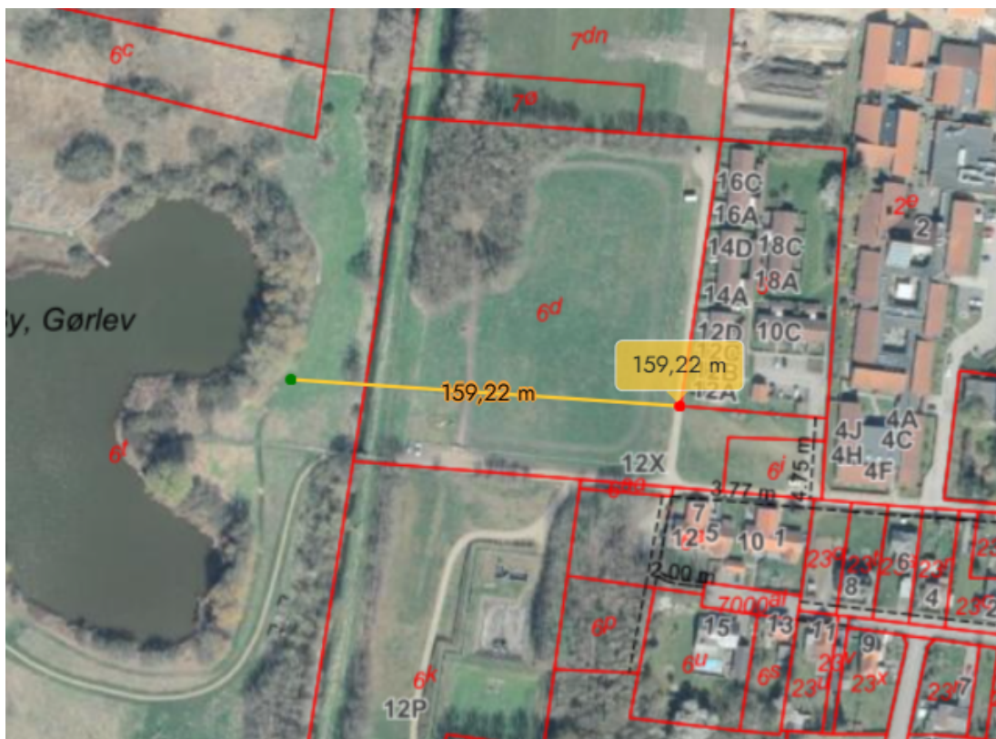
3 – Oversigtskort, som viser placeringen af det ansøgte i forhold til omkringliggende naboer.

Der er ikke foretaget naboorientering 5 , da vi vurderer, at det ansøgte er af underordnet betydning for naboerne, da der er en god afstand til nærmeste nabo, og det ansøgte ikke vil ændre områdets karakter væsentligt.