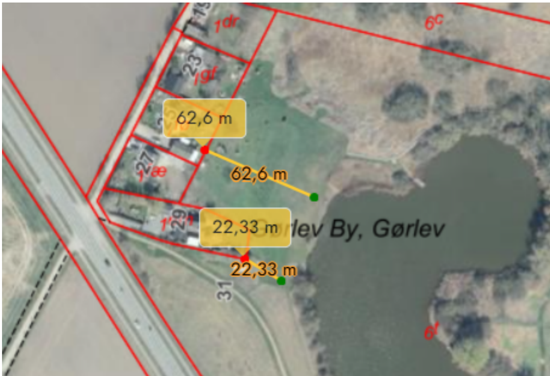
3 - Oversigtskort, som viser placeringen af det ansøgte i forhold til omkringliggende naboer.