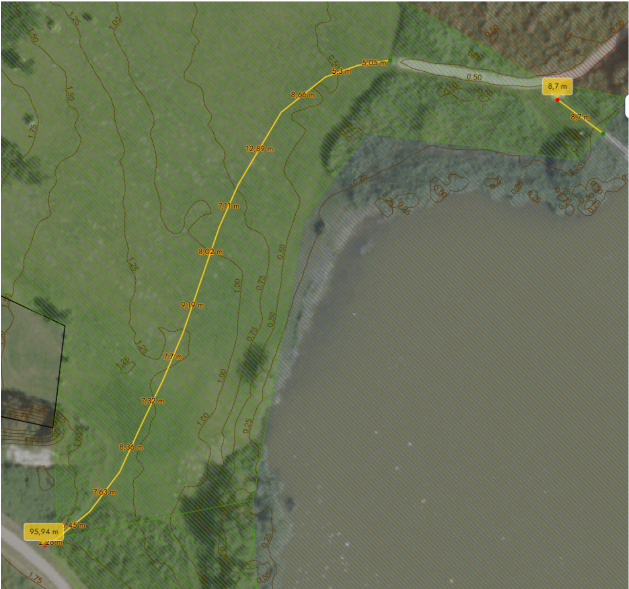
1 - Situationsplan som viser placeringen af det ansøgte.

Udførelsen af træfjællebroen vil ske i samme materialer, design og udseende som den eksisterende træfjællebro ligesom træfjællebroen belægges med skridsikker belægning lig den eksisterende.