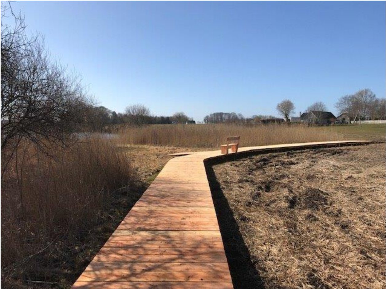
2 – Billede af eksisterende træfjællebro, som den nye bro skal opføres i stil med.