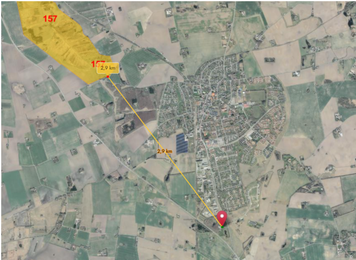
5 - Det ansøgte placering ift. det nærmeste Natura 2000-område.