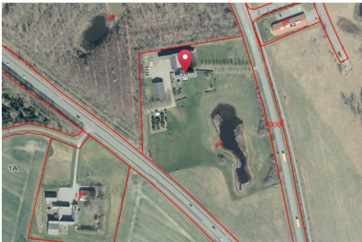
4 – Oversigtskort som viser placeringen af det ansøgte i forhold til omkringliggende naboer.

Der er ikke foretaget naboorientering 5 , da vi vurderer, at det ansøgte er af underordnet betydning for naboerne, da der ikke er nogen nære naboer, og det ansøgte ikke vil ændre områdets karakter væsentligt, idet der ikke opføres ny bebyggelse.