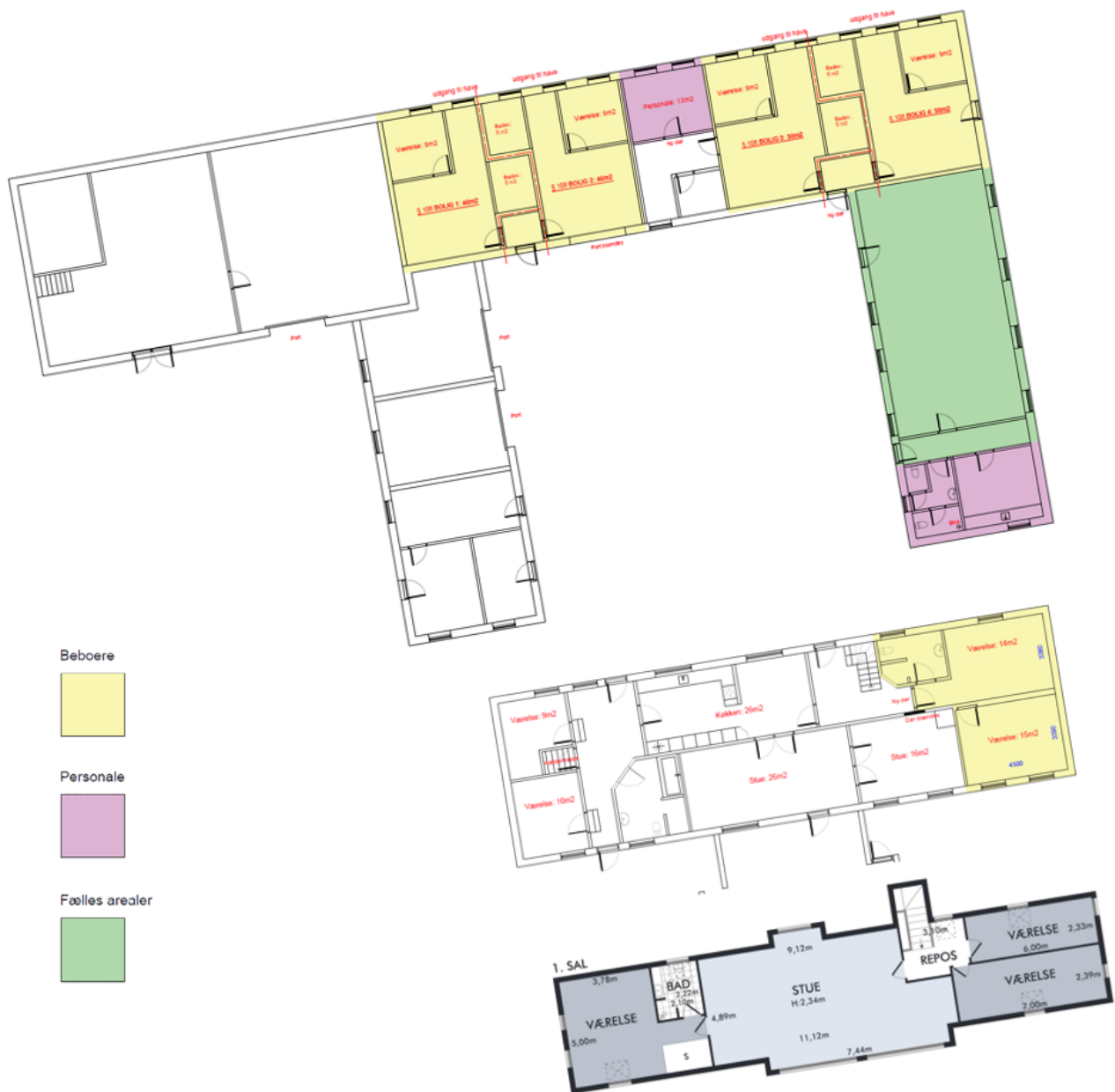
3 – Samlede plantegninger af stuehus (stueetage og 1. sal) og sekundær bebyggelse, som viser detaljeret indretning af bygningerne.