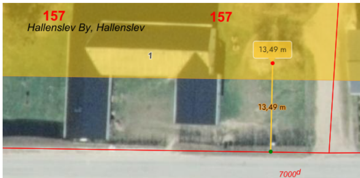
5 - Det ansøgtes placering ift. det nærmeste Natura 2000-område .

Vi har ikke noget konkret kendskab til forekomst af bilag IV-arter i det konkrete område. Vi vurderer derfor at, en ændret udnyttelse af arealet, ikke vil kunne have negativ betydning for bilag IV-arter.