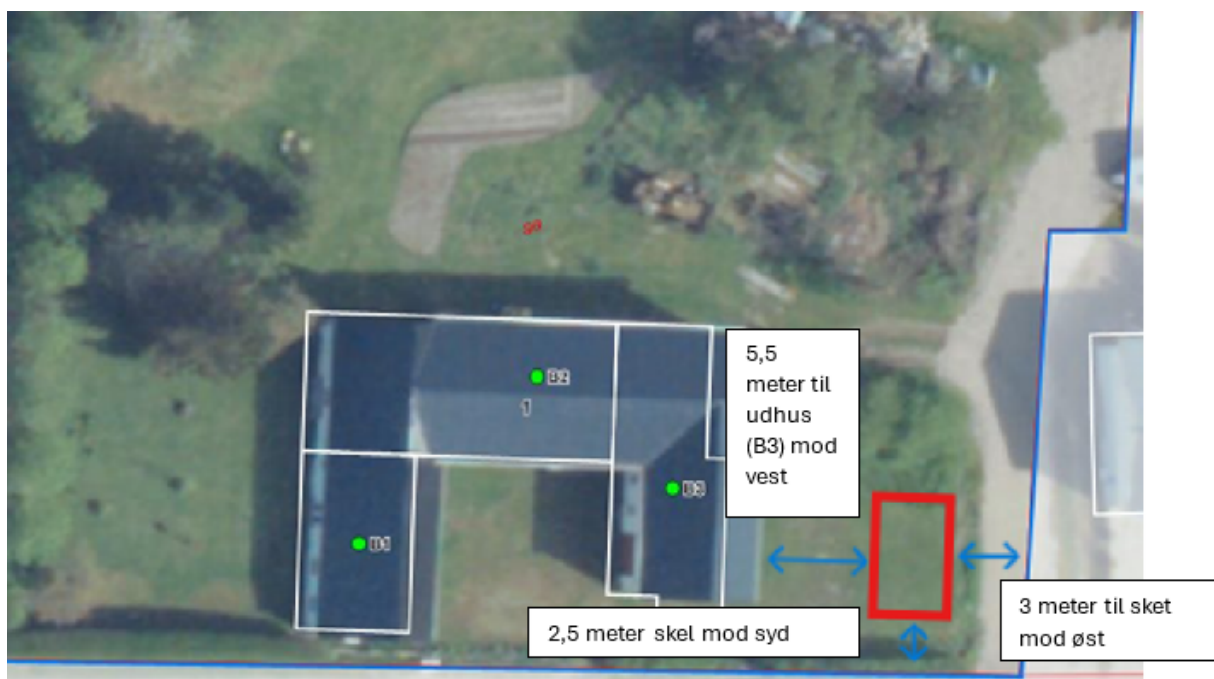
1 - Situationsplan som viser placeringen af det ansøgte.

Årsagen til, at jeg ikke bruger de staldbygninger, som findes, er, at jeg ikke kan komme ind i disse med bil/biler, trailer med videre.